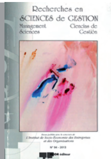
N° 94 - 200 pages FRANCAIS

. Bernard GUILLON : Un premier bilan relatif à la mesure régulière de la recherche universitaire française par les revues scientifiques francophones : 2007-2011