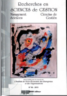
N° 96 - 246 pages FRANCAIS